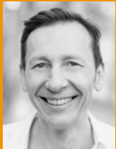
Andy Winkler MUSIC PRODUCTION

Voraussetzung: Beherrschung einfacher Grooves in verschiedenen Tempi, improvisieren von einfachen Fills www.andygrabner.com